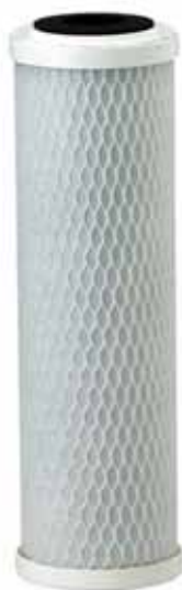
CG53-10 Cartucho de Reemplazo: EV9108-53